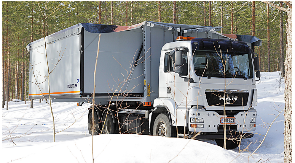
Kontti on CSC-katsastettu. Avaaminen tapahtuu automaattisesti nappia painamalla.

Oy Morehouse Ltd Koritie 3 - FIN-77700 RAUTALAMPI puh. 017 2648 600 morehouse@morehouse.fi www.morehouse.fi NCAGE A546G