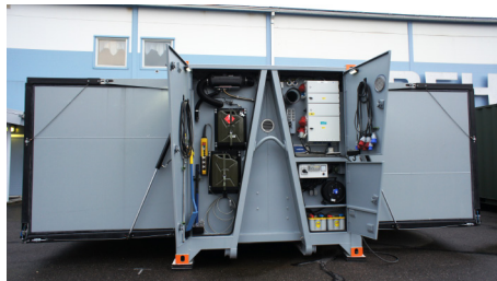
Polttoainetoimisen lisälämmittimen ansiosta kontti voidaan lämmittää kuljetuksen aikana.