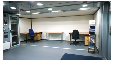
Kuten muissakin Morehouse-konteissa, kalusteet kulkevat kontin mukana myös uudessa M75i:ssä.