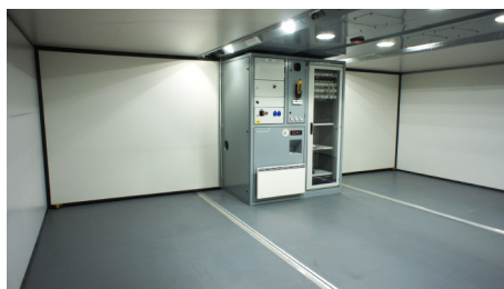
Kontin valaistus on toteutettu energia- tehokkaalla led-tekniikalla.